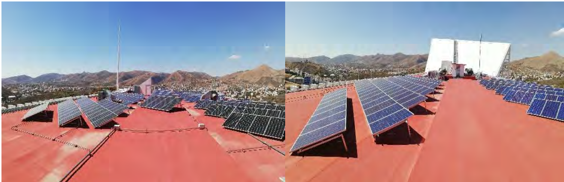
Azotea cuerpo Norte