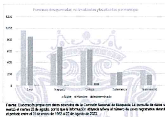
Gráfico 3: Personas desaparecidas, no localizadas y localizadas en los cinco municipios de mayor incidencia acorde a la Comisión Nacional de Búsqueda.

De acuerdo con datos de solicitudes de información 11 , desde el 10 de abril del 2019 -día en que se instaló el Consejo Estatal de Protección a Personas Defensoras de Derechos Humanos y Periodistas de Guanajuato- hasta agosto de 2023, se han registrado un total de 106 solicitudes recibidas en la Secretaría Técnica del Consejo Estatal de Protección a Personas Defensoras de Derechos Humanos y Periodistas de Guanajuato.