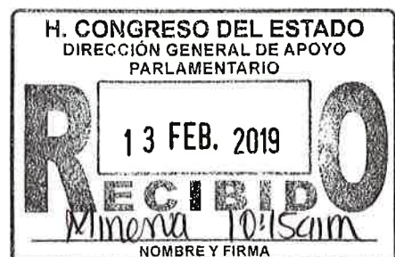
DIPUTADA NOEMÍ MÁRQUEZ MÁRQUEZ