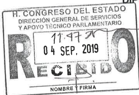
DIPUTADA JÉSSICA CABAL CEBALLOS