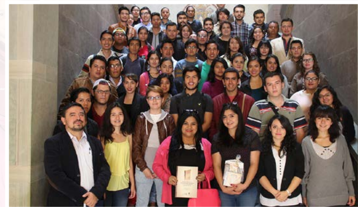
Estudiantes de la División de Derecho, Política y Gobierno de la Universidad de Guanajuato.