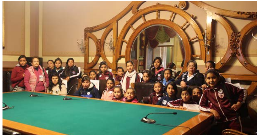
Casa Hogar para Niñas "Formación del Joven Guanajuatense".