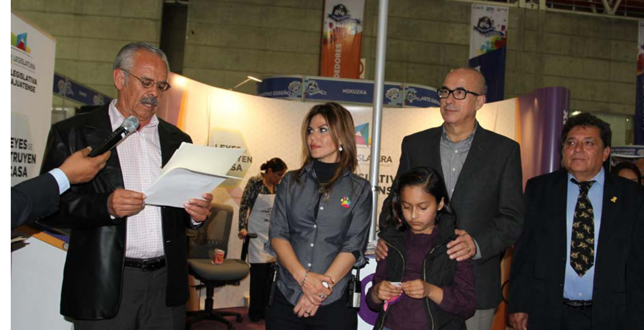
El diputado presidente del congreso del Estado, Rigoberto Paredes Villagómez indicó que en este stand podrán interactuar a manera de juego con los conceptos del quehacer parlamentario.

El stand se ofrecen diversas actividades como colorear un cuento sobre las funciones de las y los diputados. De igual forma se les invita a que participen en diversos juegos, los cuales consisten en armar un rompecabezas que permite conocer los 22 distritos que conforman la entidad; encontrar el mayor número de pares de un memorama que evoca más de 20 diferentes conceptos del quehacer legislativo; así como conocer las instalaciones del Palacio Legislativo a través de un dispositivo en tercera dimensión.