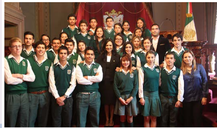
Colegio Guanajuato, Plantel Purísima del Rincón.