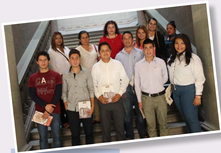
Colegio Universitario de Yahualica, San Francisco del Rincón, Gto.