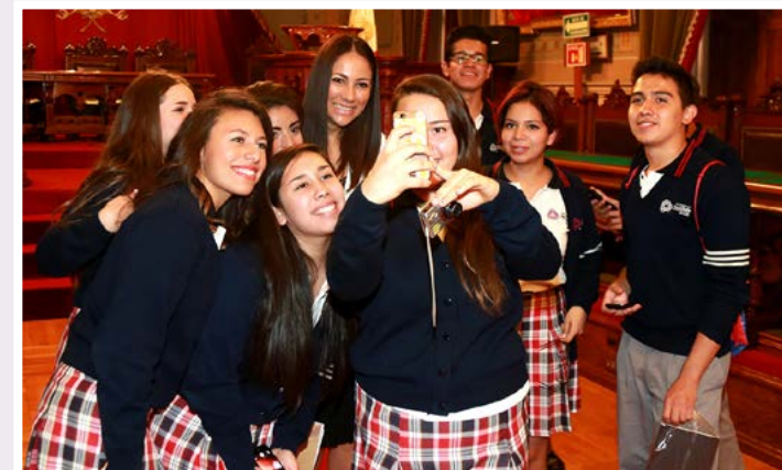
Preparatoria Universidad De La Salle Bajío, Campus Las Américas León, Gto.