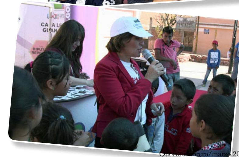
El stand de la Cultura Legislativa visitó algunas comunidades de Irapuato.