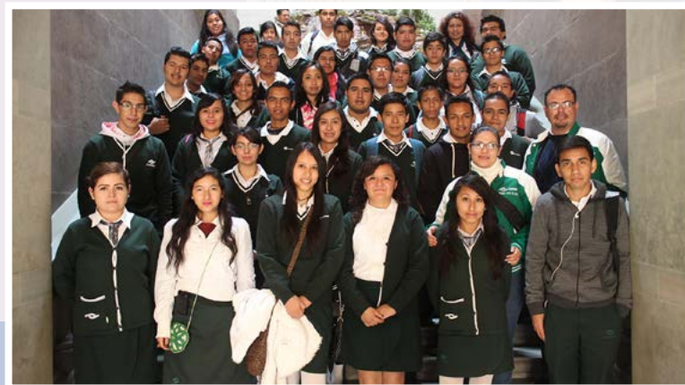
CONALEP, Valle de Santiago.