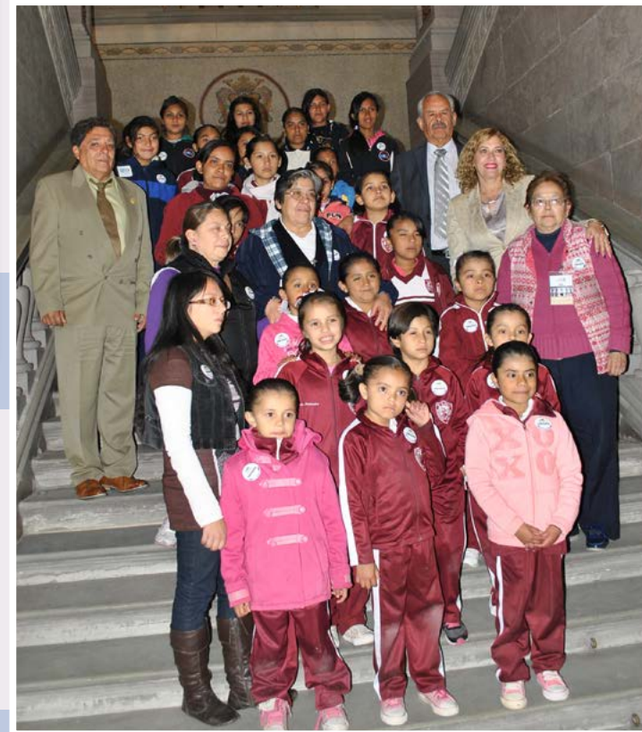
Casa Hogar para Niñas "Formación del Joven Guanajuatense".