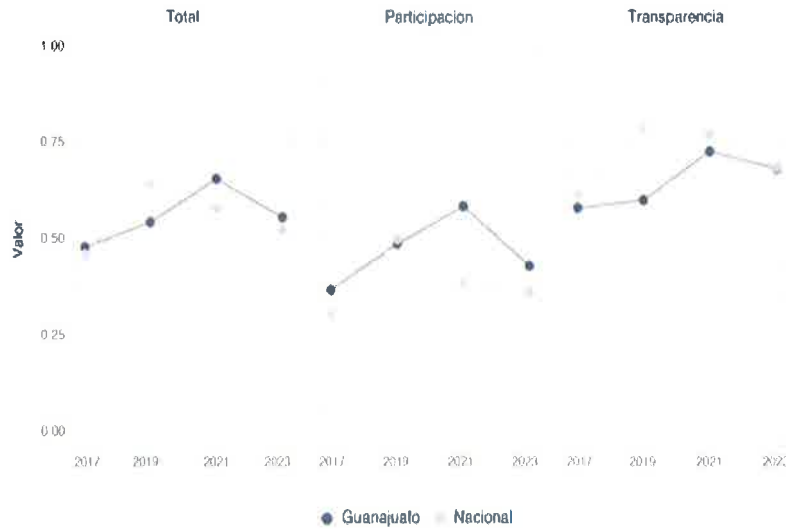
Figura 31. Evolución del Índice de Gobierno Abierto, 2017-2023.

Guanajuato continúa avanzando en materia de transparencia y combate a la corrupción, lo que le permite consolidarse como un referente a nivel nacional. En el Índice de Estado de Derecho del World Justice Project, la entidad se ubicó en la segunda posición nacional en el factor 'Ausencia de Corrupción', con un puntaje de 0.46 en 2023-2024 (World Justice Project, 2024). En cuanto a la gestión de recursos públicos, el alto grado de implementación del Presupuesto Basado en Resultados y del Sistema de Evaluación del Desempeño (PbR-SED) alcanzó el 98.5 % en 2023 y completó el 100 % en 2024, posicionando a Guanajuato en el primer lugar nacional, junto con Yucatán (Secretaría de Hacienda y Crédito Público, 2024). Estos avances refuerzan la transparencia, la eficiencia en el uso del presupuesto y la evaluación constante del desempeño gubernamental. Asimismo, el subíndice de transparencia estatal pasó de 0.58 en 2017 a 0.73 en 2021, lo que colocó a Guanajuato en la primera posición nacional en transparencia y en la quinta en calidad de la información pública, superando el promedio nacional (Secretaría de Hacienda y Crédito Público, 2024).»