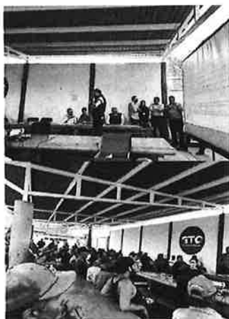
REUNION INFORMATIVA «EL REFUGIO». 29 DE MAYO DE 2023

3.- En fecha del 29 de mayo del presente, se celebró Reunión Informativa en la comunidad ladrillera de «El Refugio», con participación de la Secretaría de Gobierno, la Secretaría del Agua y Medio Ambiente, la Procuraduría Ambiental y de Ordenamiento Territorial del estado, el Secretario del Ayuntamiento y otras autoridades del municipio de León, en la cual se informó a los productores sobre los avances del proceso de escrituración y los requisitos que deberán presentar para el mismo; además se escucharon las demandas de los productores, y se generaron nuevos compromisos para su atención, como mesas de trabajo para temas de diversificación y comercialización. Adicionalmente 2 productores ladrilleros manifestaron su interés de contar con un horno MK2 mejorado, con lo cual se hace patente el compromiso de los productores para seguir participando en la implementación de la Estrategia.