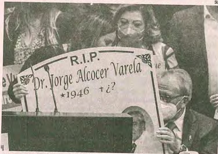
Los panistas invadieron la tribuna en la comparecencia de Alcocer.

Con mirada seria, el funcionario, quien antes tardó casi 10 minutos en recorrer el salón de sesiones ya que diputados del PT y Morena le pidieron fotos, recibió el regalo.