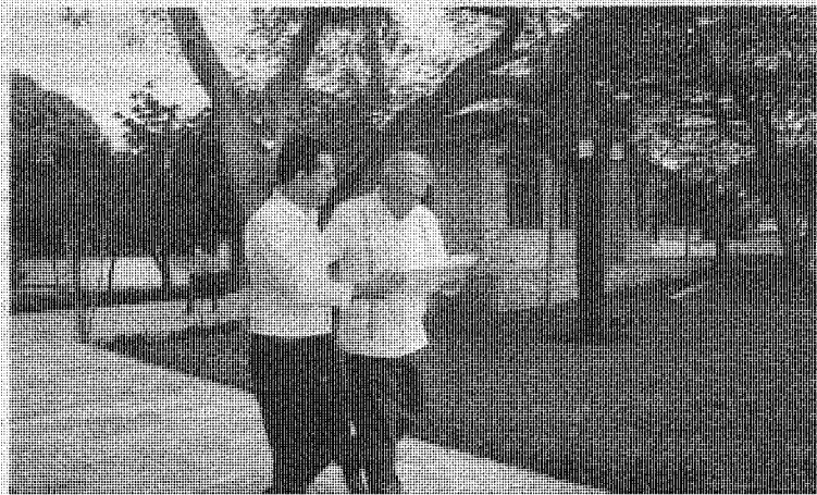
El López Obrador inició ayer en Yucatán su última gira del año y junto al gobernador Mauricio Vila (PAN) supervisó los avances del Tren Maya.

Determinaron aplazar la revocación de mandato que se realizaría en abril en caso de juntar las firmas necesarias, lo anterior, pese a que se