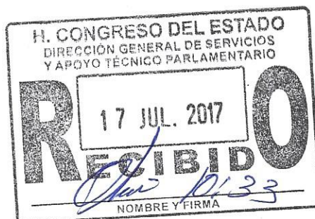
Diputado Rigoberto Paredes Villagómez Grupo Parlamentario de PRI