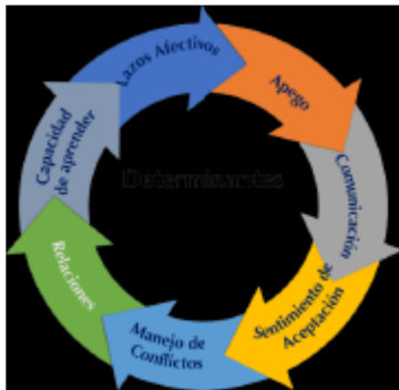
Ilustración 1. Determinantes de Salud Mental de la familia.

Respecto a las dimensiones de diagnóstico, se sugiere abordar del total de aspectos que impactan la salud mental de la familia al menos los siguientes: