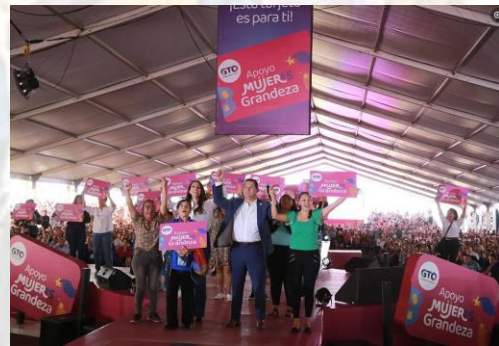
Presentación del Programa Mujeres Grandeza del 22 de mayo de 2023 en el Parque Guanajuato Bicentenario, Silao, Guanajuato

Desde su lanzamiento y hasta la fecha, el grueso de la información relativa al programa social ha privilegiado el uso electoral sin preocuparse por aclarar la naturaleza pública y ajena a cualquier partido del programa.