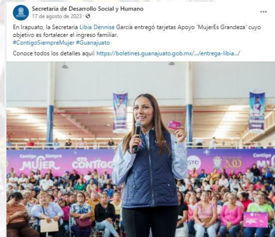
Publicación de la cuenta de la Secretaría de Desarrollo Social y Humano en la red social Facebook del 17 de agosto de 2023. Disponible en https://www.facebook.com/sedeshugto/posts/pfbidO2yWkYNNQVbjgG876KyMRBS6RfkezuijV3RbMijjSf6wok6kPPLxFBnrDo9uPsq_H5rl