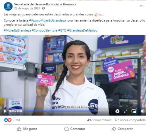
Video publicado en la cuenta de la Secretaría de Desarrollo Social y Humano en la red social Facebook del 23 de mayo de 2023. Disponible en