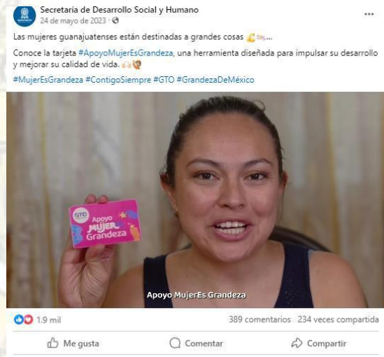
Video publicado en la cuenta de la Secretaría de Desarrollo Social y Humano en la red social Facebook del 24 de mayo de 2023. Disponible en https://fb.watch/s41D-8iBHC/