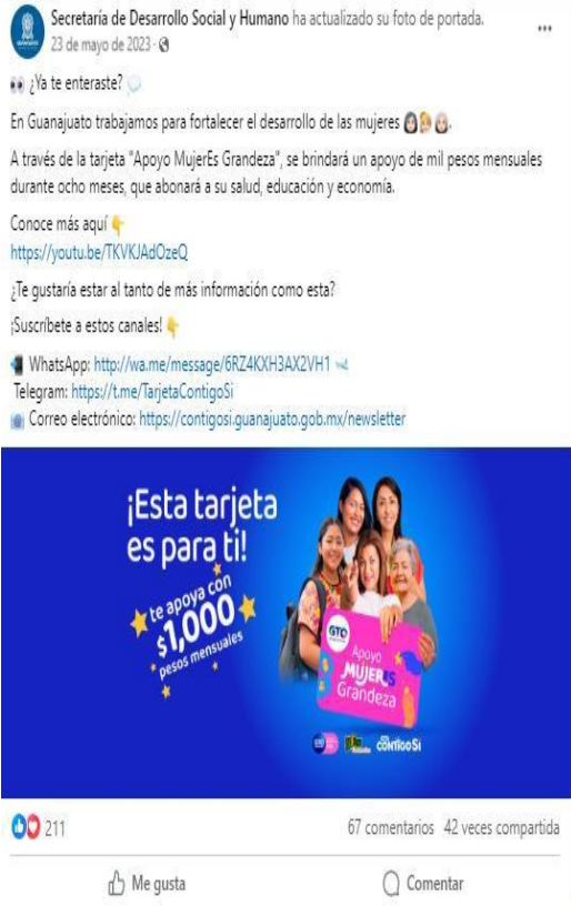
Publicación de la cuenta de la Secretaría de Desarrollo Social y Humano en la red social Facebook del 23 de mayo de 2023. Disponible en https://www.facebook.com/photo/?fbid=6638084249568696&set=a.457612144282635