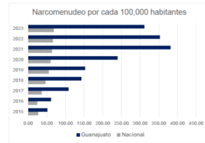
Gráfica 4. Elaboración propia con datos del Secretariado Ejecutivo del Sistema Nacional de Seguridad Pública.

Estos datos, son muestra clara de que hace falta un cambio contundente en la forma en que se administra y se proporciona la seguridad en el Estado de Guanajuato.