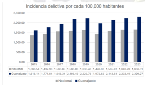
Gráfica 1. Elaboración propia con datos del Secretariado Ejecutivo del Sistema Nacional de Seguridad Pública

Los datos hablan por sí mismos, es necesario hacer cambios en las legislaciones sobre seguridad para encontrar resultados favorables para la ciudadanía Guanajuatense.